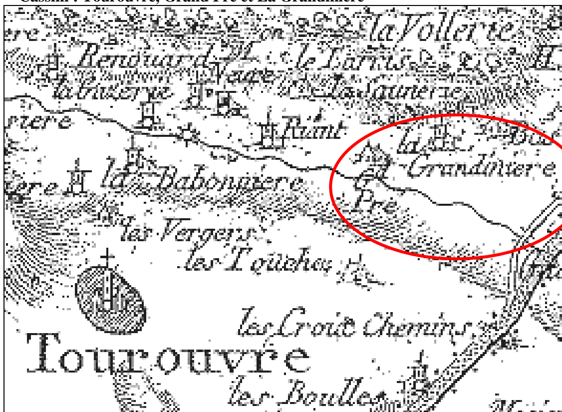
Cassini : Tourouvre, Grand Pré et La Grandinière